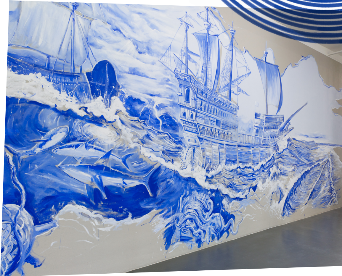
Marcos Castro, Era una noche lluviosa, pero no era de noche ni estaba lloviendo [Het was een regenachtige avond, maar het was noch avond noch regende het], 2020.

De kunstenaar Marcos Castro deed diepgravend onderzoek naar de betekenis van de kleur blauw in zijn geboorteland Mexico. Zijn kunstwerken bestaan uit grote wandschilderingen die vaak verwijzen naar de geschiedenis van Mexico. Op de foto in deze opdracht zie je de wandschildering die Castro maakte in de tentoonstellingsruimte van Witte de With Center for Contemporary Art. Deze blauwe schildering is ongeveer 28 meter lang en is verdeeld over drie muren in de kleur blauw. Samen met zijn assistent werkte Castro veertien dagen aaneengesloten aan dit kunstwerk. Castro schetst eerst met potlood op de muur om er vervolgens met de vrije hand overheen te schilderen. Met dit werk probeert Castro de bestaande geschiedenis van Mexico om te zetten in nieuwe verhalen waarmee iedereen zich kan verbinden. De muurschildering verwijst ook naar de hedendaagse kunst van Mexico, waarin muurschilderingen op de straat een belangrijk onderdeel zijn van het dagelijks leven. Het is vergelijkbaar met bijvoorbeeld graffiti, wat op dezelfde manier laat zien hoe je door middel van kunst, verhalen kan vertellen in de stad.